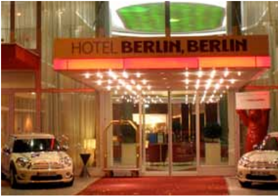
Hotel Berlin, Berlin • Lützowplatz 17 • 10785 Berlin

Das Vier-Sterne Hotel Berlin, Berlin ist unser offizielles Tagungshotel.